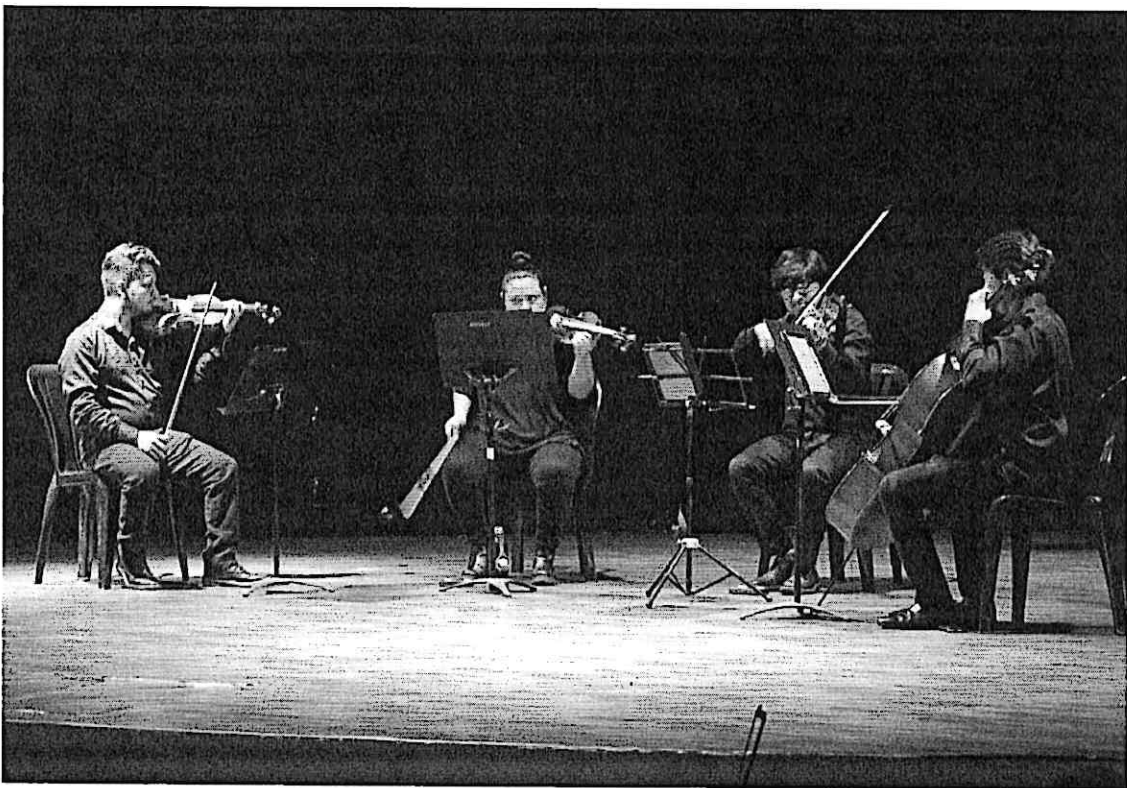
Cuarteto primavera durante el concierto