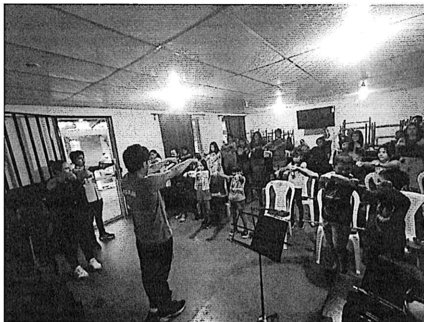
Estudiantes realizando ejercicios de calentamiento junto al Cuarteto Primavera

Los talleres se impartieron de 15:00 a 18:00 horas, seguidamente del concierto realizado a las 19:00 horas, ambas actividades se realizaron en el Colegio Luterano de Zacapa. Las personas asistentes al concierto disfrutaron del repertorio preparado para la ocasión, especialmente cuando se ejecutó la sección de música guatemalteca en donde se pudo apreciar a la gente muy contenta cuando se interpretó el tema "Soy de Zacapa". El grupo de alumnos con el que se trabajó era de nivel inicial e intermedio, los cuales durante la presentación se unieron a los jóvenes de viento y percusión para interpretar canciones populares.