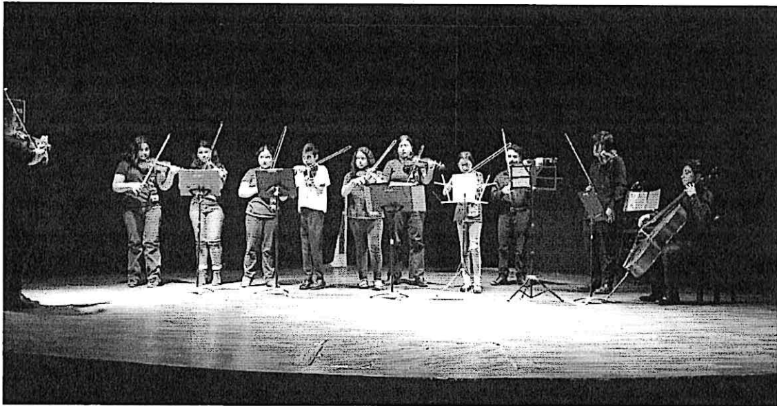
Cuarteto Primera en ensamble junto a alumnos del Conservatorio Regional de Música "Eulalio Samayoa" durante el concierto.