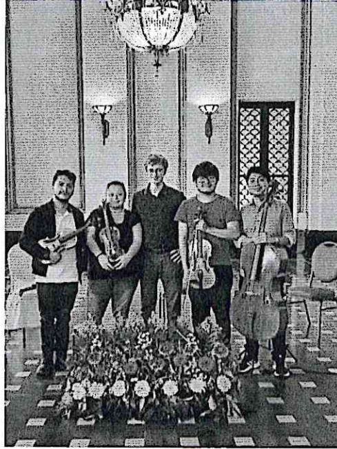
Cuarteto Primavera junto al violinista francés Frédéric Pelassy, al final del ensayo