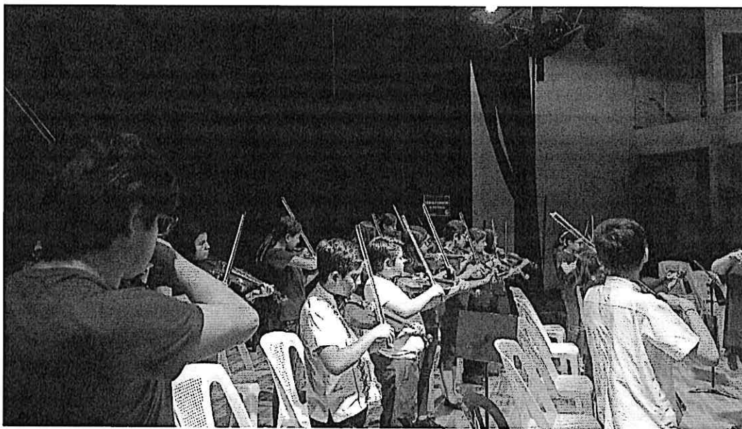
Alumnos del Conservatorio Regional de Música "Eulalio Samayoa" en talleres junto a los integrantes del Cuarteto Primavera

Los talleres se impartieron de 14:00 a 16:00 horas, seguidamente del concierto realizado a las 16:30 horas, ambas actividades se realizaron en el Centro Cultural de Escuintla. Para esta ocasión, se contó con una canción de la región titulada "Noches de Escuintla", la cual fue estudiada y montada por el Cuarteto Primavera para que los asistentes pudieran disfrutar de la pieza en el formato de Cuarteto de Cuerdas, los cuales mostraron una respuesta favorable, llena de alegría y agradecimiento. Para la presentación, se integraron los alumnos del Conservatorio Regional "Eulalio Samayoa", los cuales recibieron talleres previos al concierto.