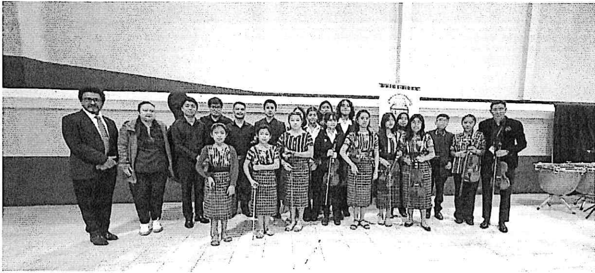
Profesores, alumnos y director de la Escuela Elemental de música "Elías García" junto al Cuarteto Primavera al finalizar el concierto