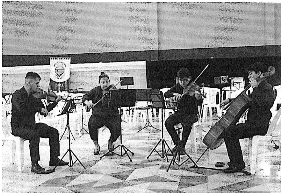
Cuarteto primavera durante su presentación