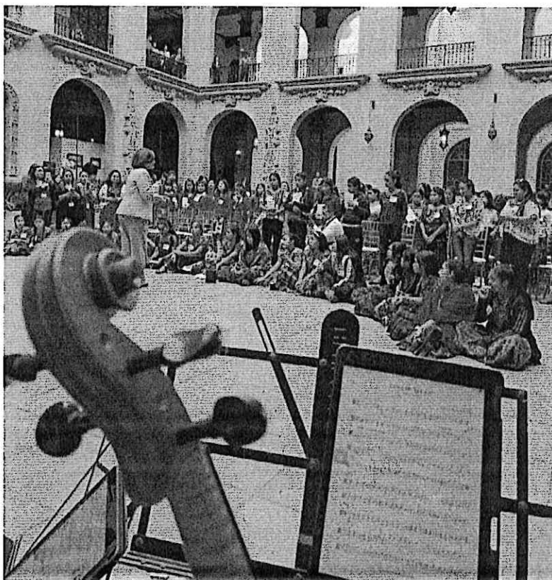
La vicepresidente de la República de Guatemala – Karin Herrera, interactuando con los asistentes del ensayo abierto en el Palacio Nacional de la Cultura

Para estos ensayos se contó con la visita de estudiantes de Chinautla, y la visita de la vicepresidente de la República de Guatemala, Karin Herrera. En estos ensayos abiertos se trabajó y presentó parte del repertorio de los conciertos en Escuintla, San Juan Sacatepéquez y la Gala "Uniendo notas Francia-Guatemala".