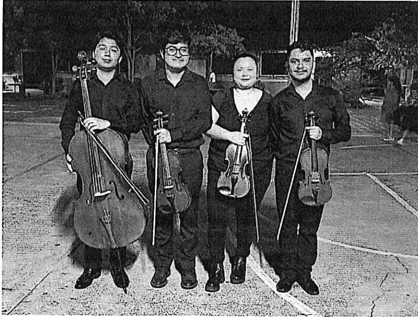
Integrantes del Cuarteto Primavera luego de su participación