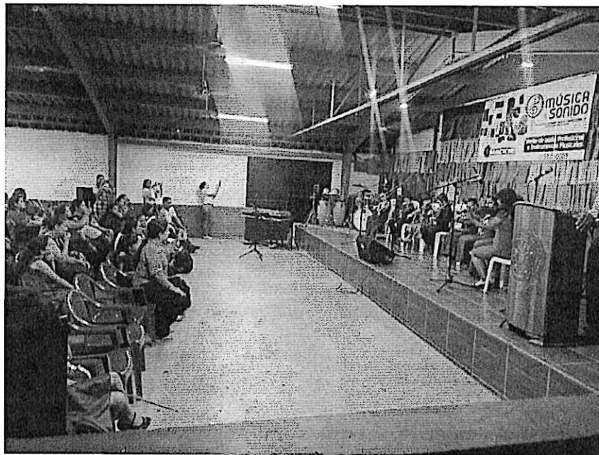
Alumnos de la Orquesta Juvenil de Zacapa durante el concierto, siendo grabados por el público presente.