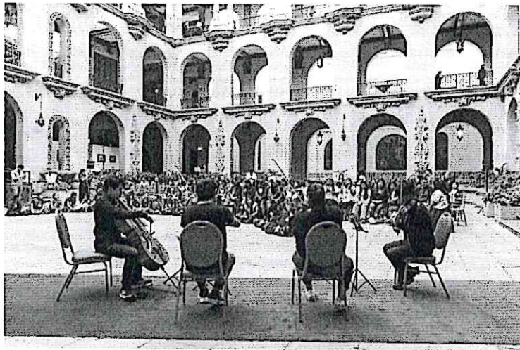
Cuarteto primavera frente a los asistentes de los ensayos abiertos